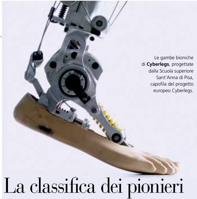
Le gambe bioniche di Cyberlegs , progettate dalla Scuola superiore Sant'Anna di Pisa, capofila del progetto europeo Cyberlegs.